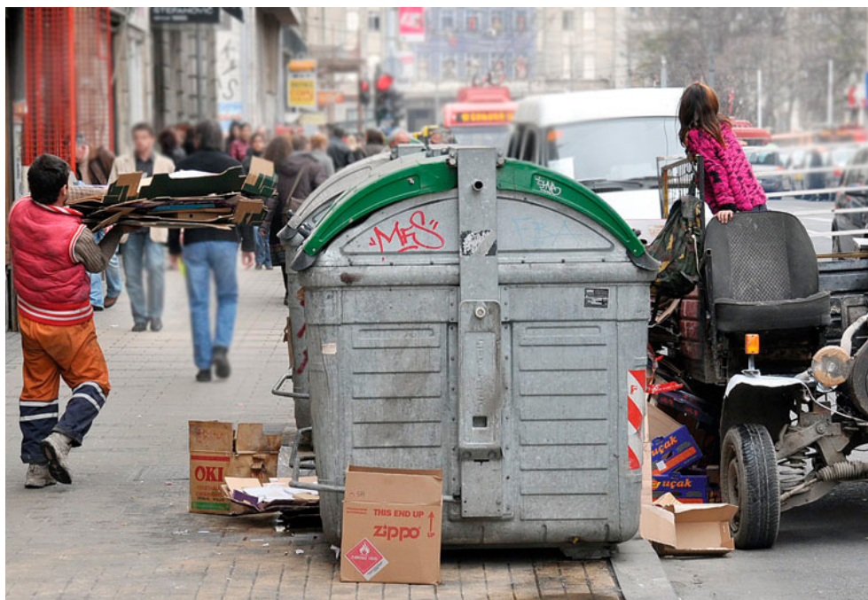
Sakupljači sekundarnih sirovina na svakodnevnom poslu